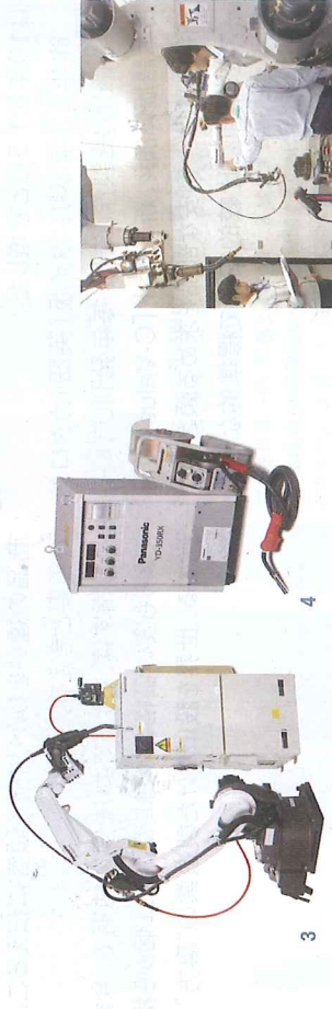
1. 「設備・サービス・ソリューションの三位一体の営業を目指す」と話す山中英一MD(後方右から4番目)と同部門スタッフたち 2. 高性能電子部品実装機NPMシリーズ 3. アーク溶接ロボット Active TAWERS 4. 省エネインバータ溶接機 350FX1 5. 顧客サービスの一環として、展示、実証、トレーニングのためのFATCを設置。溶接のノウハウ、実装機のトレーニングなどベテランのエンジニアたちが丁寧に技術指導している

TEL:02-693-3418~20(実装機、内線31150) 02-693-3421(溶接、内線31160) 252/133 Mitang Thai-Phatra Complex Bldg. 2, 31st Fl., Rachadaphisek Rd., Huaykwang, Bangkok 10320 URL: www.panasonic.co.th E-mail: kondou.naruhiko@jp.panasonic.com (実装機) kawamishii.yoshinari@jp.panasonic.com (溶接)